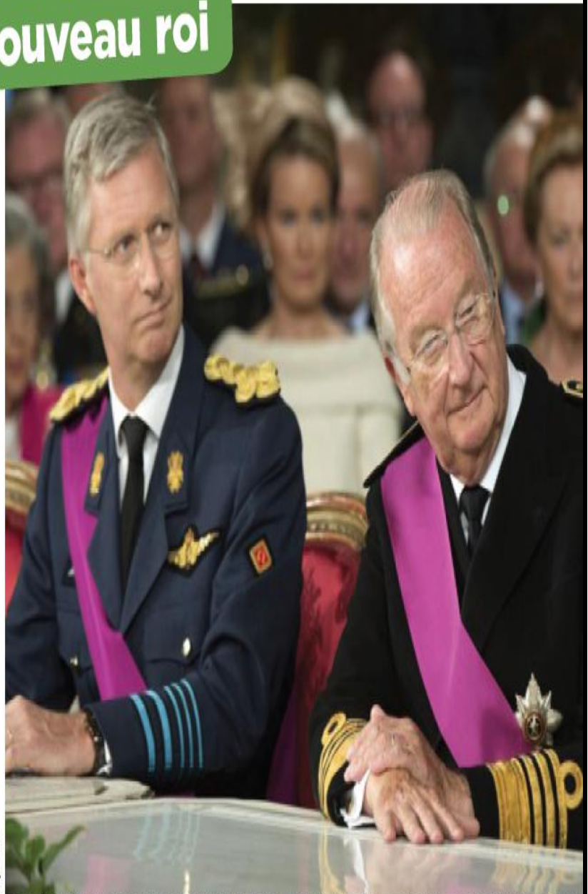
Le nouveau roi, Philippe (à gauche), à côté du roi Albert II, son père, qui a été le souverain des Belges pendant 20 ans.

À l'occasion de cette actualité royale, le JDE propose de retracer l'histoire de la dynastie (famille de rois) belge.