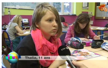
Thalia : -

Avec des antennes / avec peu de chaînes / en noir et blanc / petite / sans télécommande / sans diffusion continue