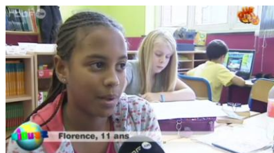
Florence : -